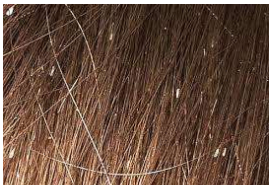
gnidy na włosach

Dzieciom należy uzmysławiać, że nie pożyczają się grzebieni i szczotek, że pożyczanie zwykłej gumki do włosów może sprawić, że zyskamy niechcianego lokatora. Nie ma skutecznych metod zapobiegających zakażeniu się wszawicą. Chemiczne repelenty niejednokrotnie okazują się mało skuteczne, gdyż wszy wykształcają odporność na insektycydy, silikony i inhibitory rozwoju. Nie należy stosować profilaktycznie leków przeciwko wszawicy, ponieważ pasożyty się na nie uodparniają. Najbardziej skuteczną metodą jest częsta kontrola skóry głowy i włosów dzieci i natychmiastowa reakcja. Zaleca się, aby stała się ona nawykiem rodziców, zwłaszcza, jeżeli w przedszkolu lub szkole panuje wszawica - istnieje duże prawdopodobieństwo zarażenia! Wczesne zauważenie obecności pasożytów pozwoli nam szybko je wyeliminować. Codzienne czesanie włosów grzebieniem elektronicznym po powrocie dziecka z placówki, w której panuje wszawica gwarantuje, że uchronimy je przed pasożytami.