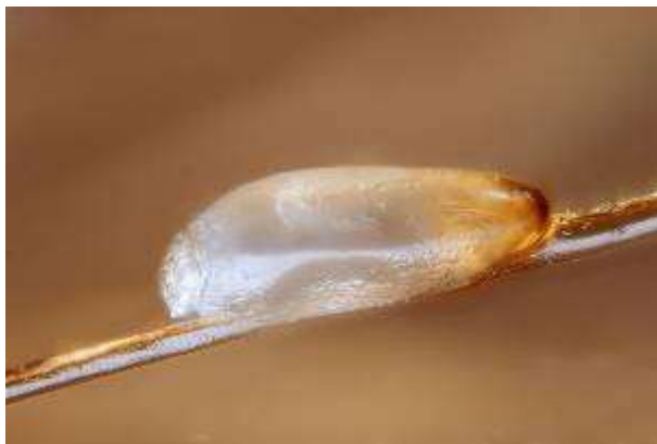
gnida – jajo wszy na włosie

włosów gnid, które mogą przypominać łupież, jednakże w przeciwieństwie do łupieżu nie przesuwiają się w wyniku dmuchnięcia we włosy, gdyż są trwale przymocowane do włosa.